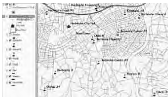
図13 中心街付近の中学校、高等学校（ラベル付き）