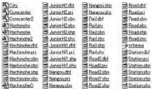
図9 完成したファイル群 (一部)

このcsvファイルを含め、シェープファイルと共にArc Mapに読み込ませ、Arc Mapファイル Hachinohe.mxdを作成した。なおComcenter2, JuniorH2等ファイル名の最後に「2」のついたものは南郷区に関するファイルである。(図9)