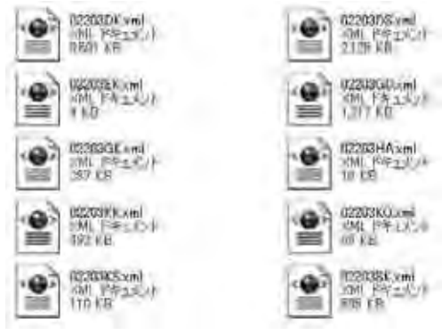
図2 xmlファイルに変換

今回の地図はラベルをアルファベット（ローマ字、英語の略語）で表示するため文字数が多くなる。また大きなフォントが必要であり、学校関係を表示させると他の施設のラベルも表示されるので極めて煩雑になり、特に外国人には判別が困難となる。