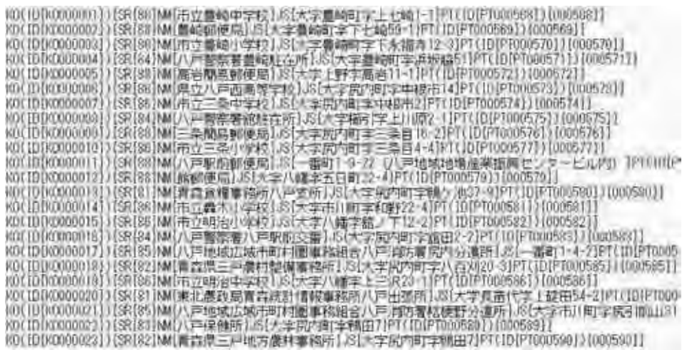
図3 公共施設が記録したKO.salの内容

そこで公共施設のデータが収められているKO.salファイルやKO.xmlファイルをテキストエディター（ここではメモ帳）で開いてみると図3、図4のようになっている。