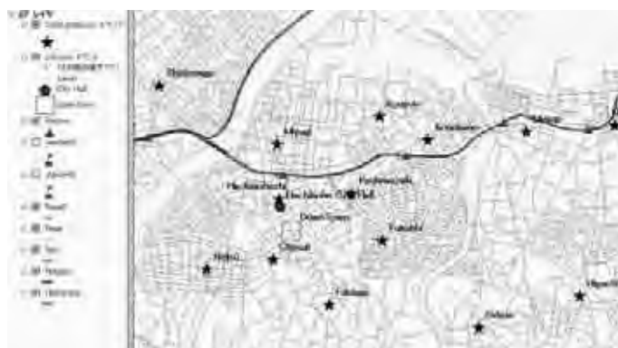
図14 中心街付近の公民館（ラベル付き）