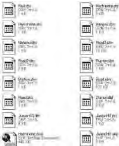
図7 shpファイルに変換